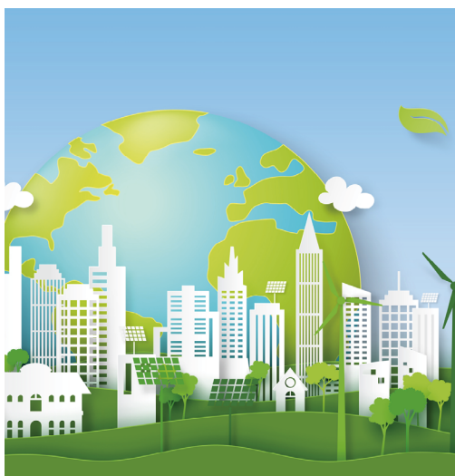
bo i städer