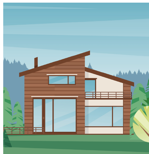
bo i hus