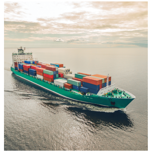
frakt av varor